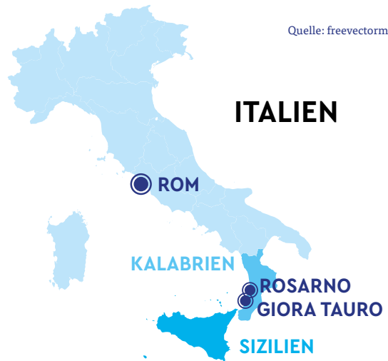
KARTE 1: ITALIEN

Sklavenähnliche Arbeitsverhältnisse auf den Plantagen sorgten in den vergangenen Jahren immer wieder für Schlagzeilen: 2010 protestierten in Rosarno, einer Stadt nahe der Ebene von Giora Tauro, 2.000 afrikanische Saisonarbeiter gegen ihre unmenschlichen Arbeits- und Lebensbedingungen, nachdem zwei italienische Jugendliche einen Arbeiter erschossen hatten. Die Bevölkerung des Ortes reagierte mit Angst und Gewalt auf die Protestierenden. 66 Menschen wurden bei den Auseinandersetzungen zum Teil schwer verletzt.