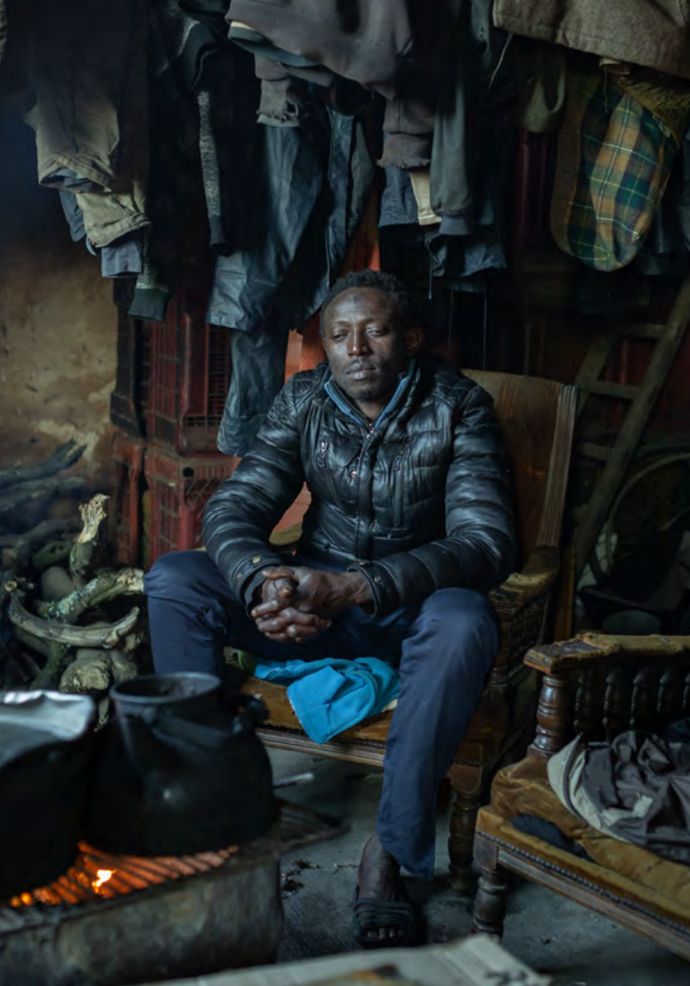
Während der Erntesaison leben die Wanderarbeiter oft in Unterkünften ohne Elektrizität und fließendes Wasser.

oder Bauernhäusern. Die italienische Agrar-Gewerkschaft FLAI-CGIL schätzt, dass es in ganz Italien für die Arbeit im Obst- und Gemüseanbau zwischen 60-80 informelle Slums gibt, in denen ca. 100.000 Menschen leben. Aus EU-Mitteln hat die Gemeinde Rosarno 30 Wohnungen und ein weiteres Lager für Wanderarbeiter*innen erbaut. Infolge des Widerstands der einheimischen Bevölkerung gegen die Nutzung dieser Unterkünfte stehen diese jedoch leer.