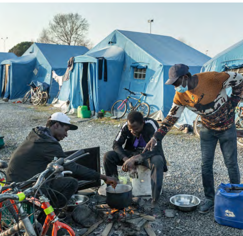
Im Camp kochen die Erntehelfer gemeinsam im Freien über offenem Feuer.

Zivilgesellschaft bekannt werden, finden keine Berücksichtigung in der Bewertung. So kommt es immer wieder zu Zertifizierungen von Agrarbetrieben, denen sogar Strafverfahren anhängig sind.